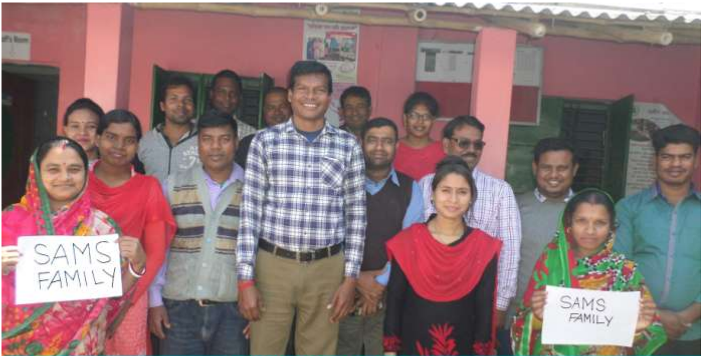
All Staffs of SAMS