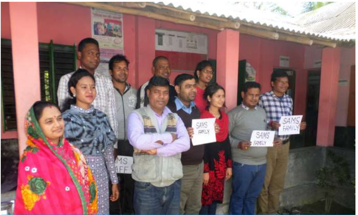
Old Family Members of SAMS