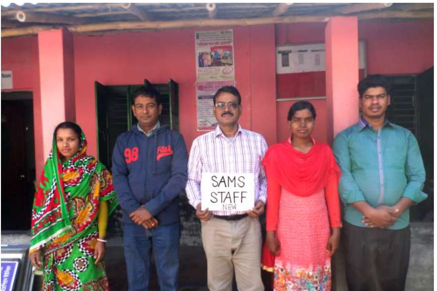
New Family Members of SAMS