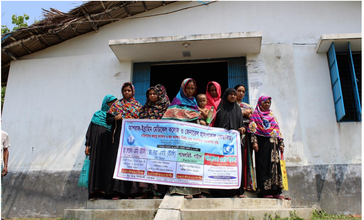
Women waiting for the “Gynecologist” at the clinic of AIMCH