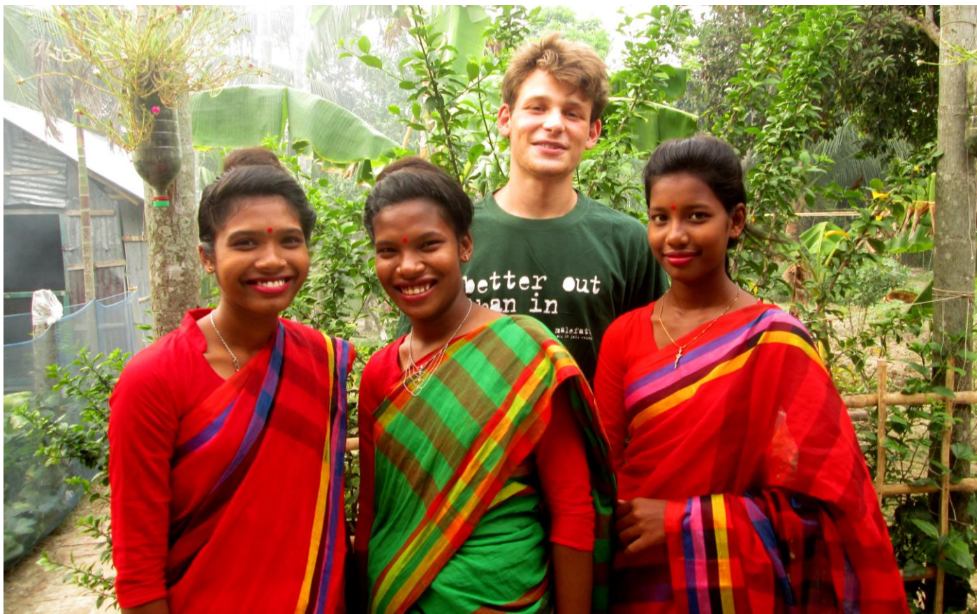
Girls: – He’s such a tall guy... he makes us look short!