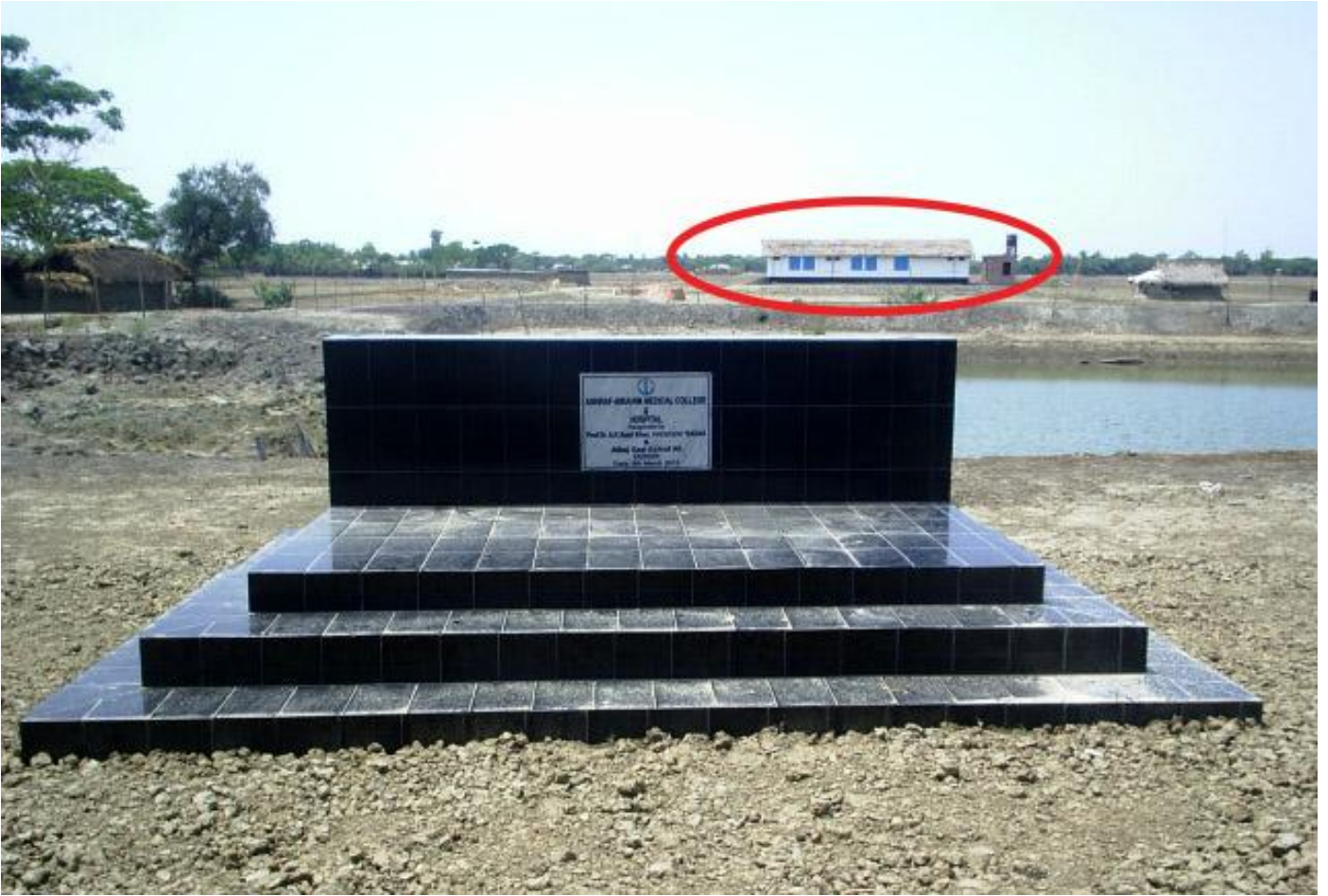
The clinic of AIMCH in শ্রীফলকাটি (Shreefalkati)