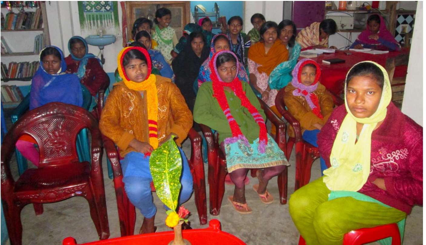
Videos on the Nativity