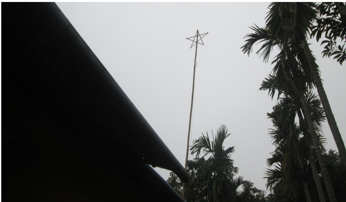
Our Xmas' Star and banner