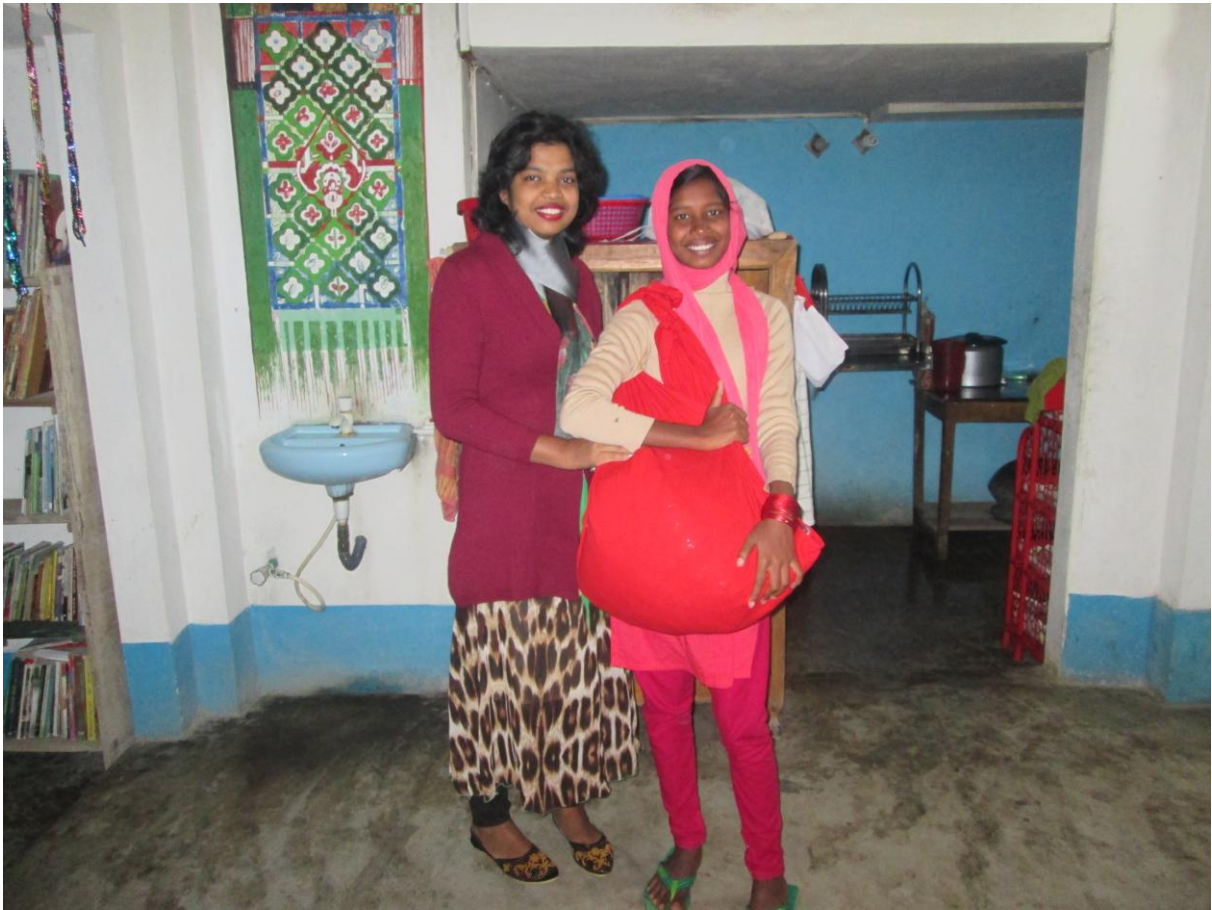
A pair of slippers for Sulota