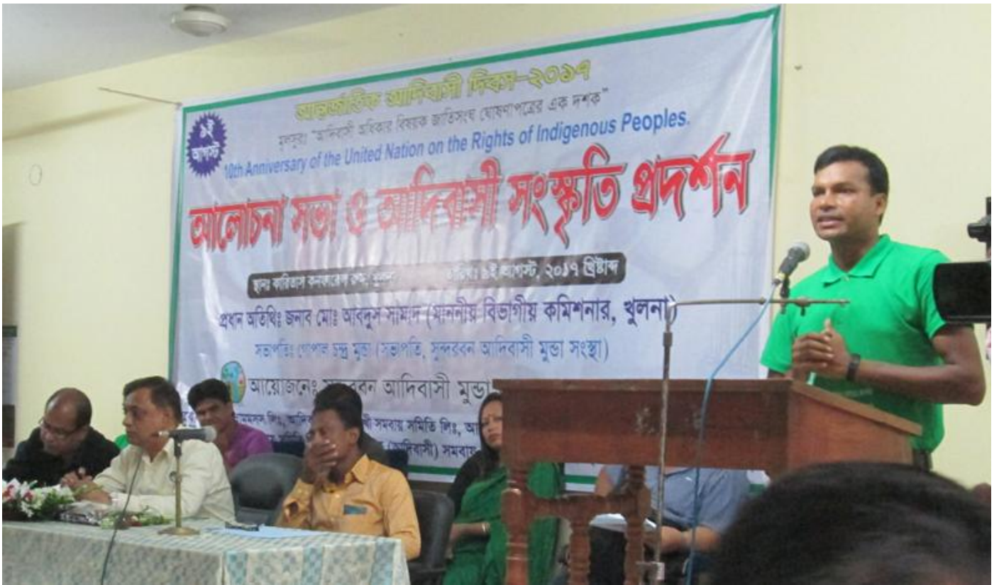
Rally of the Munda Students in Khulna