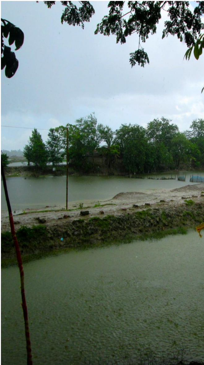
A small piece of land for rice cultivation near Jisur Nam Ashram

It is a curse because it causes devastating floods and disrupts completely people's ordinary life but it is a blessing at the same time because wherever there is a cultivable piece of land rice seedlings are planted. In a few months' time these seedlings will produce abundant rice, the staple food of the inhabitants of these countries.